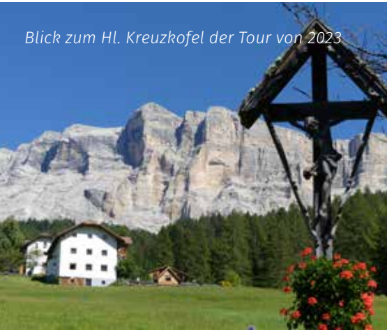
Blick zum Hl. Kreuzkofel der Tour von 2023